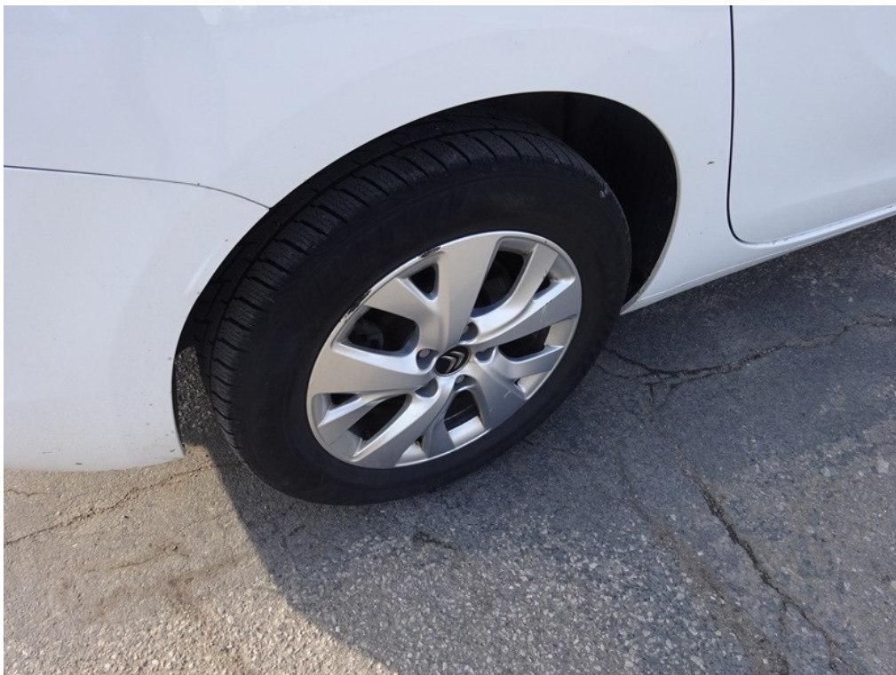
Viz popis k poškození č. 4