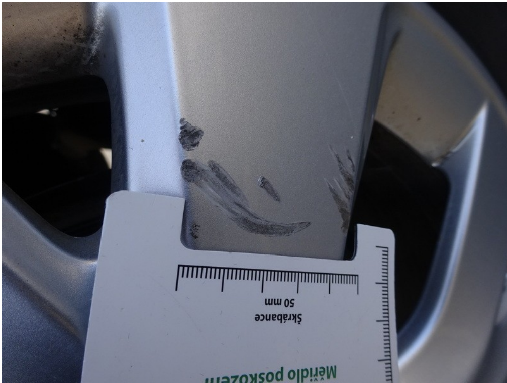
Viz popis k poškození č. 4