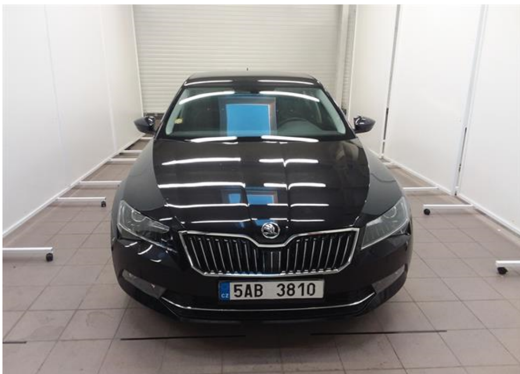
Přední část vozu