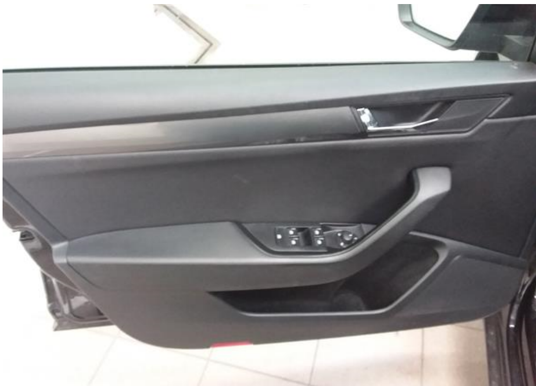
Dveře řidiče vnitřní část