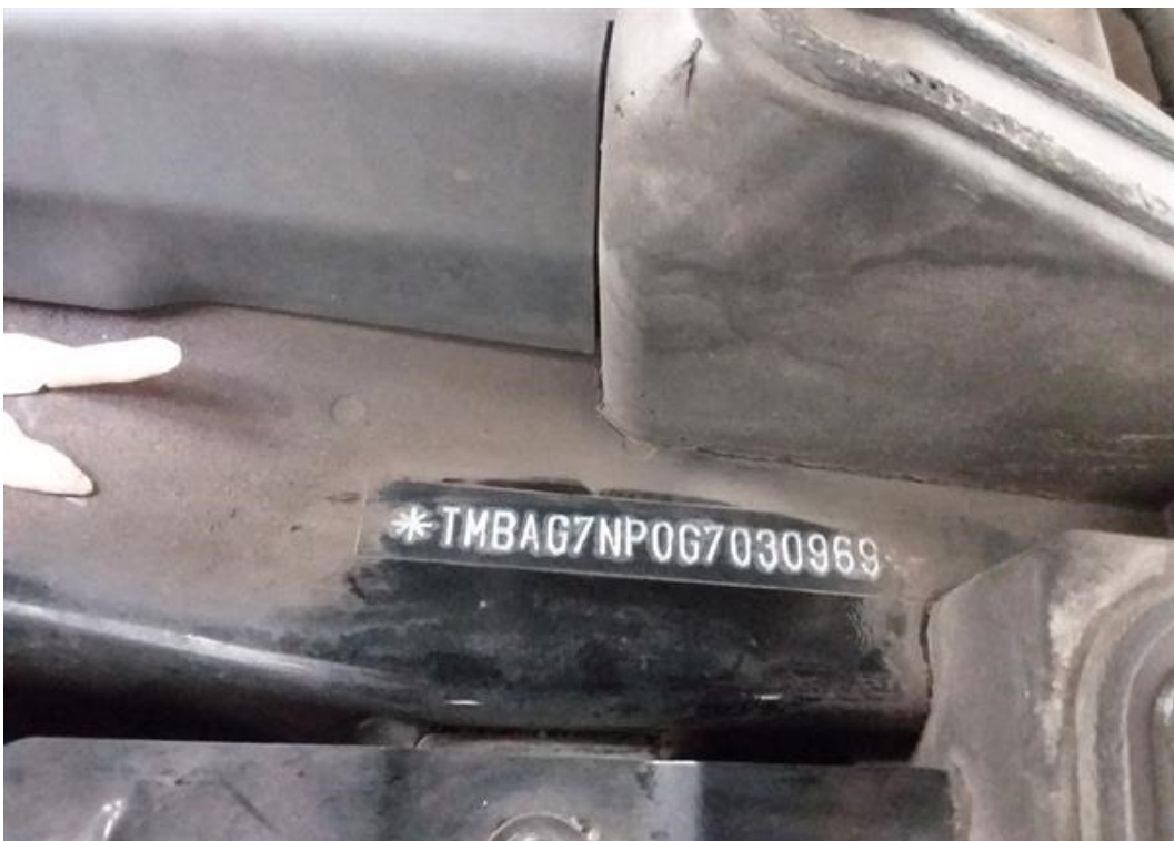
Foto VIN 2