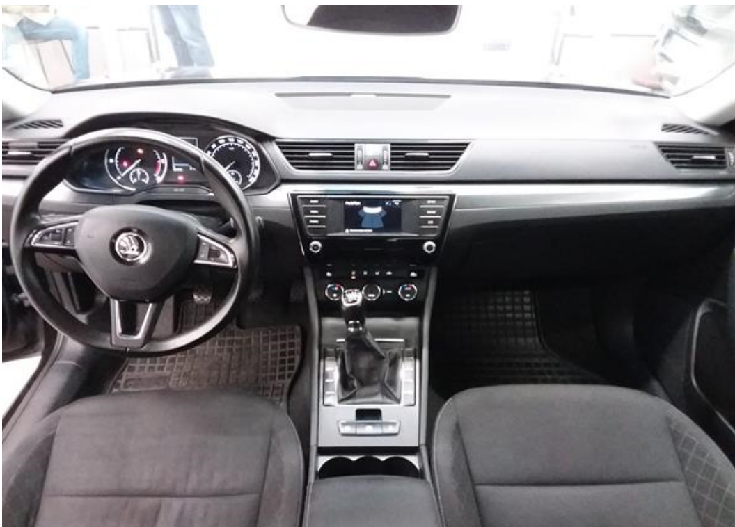
Palubní deska celá