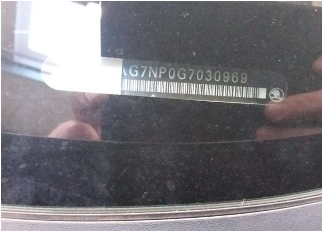
Foto VIN 1