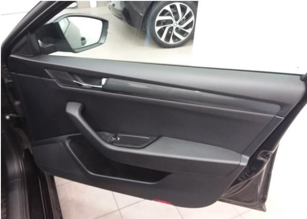
Dveře spolujezdce vnitřní část