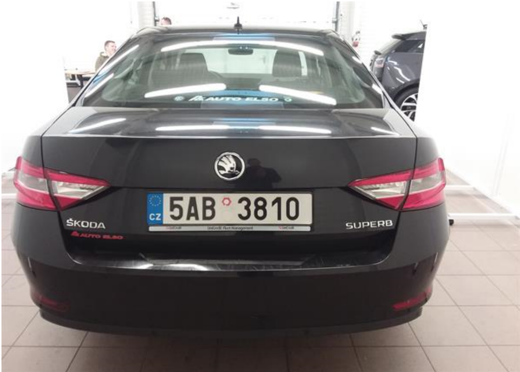
Zadní část vozu