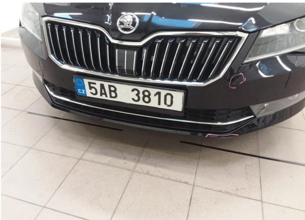
Viz popis k poškození č. 2