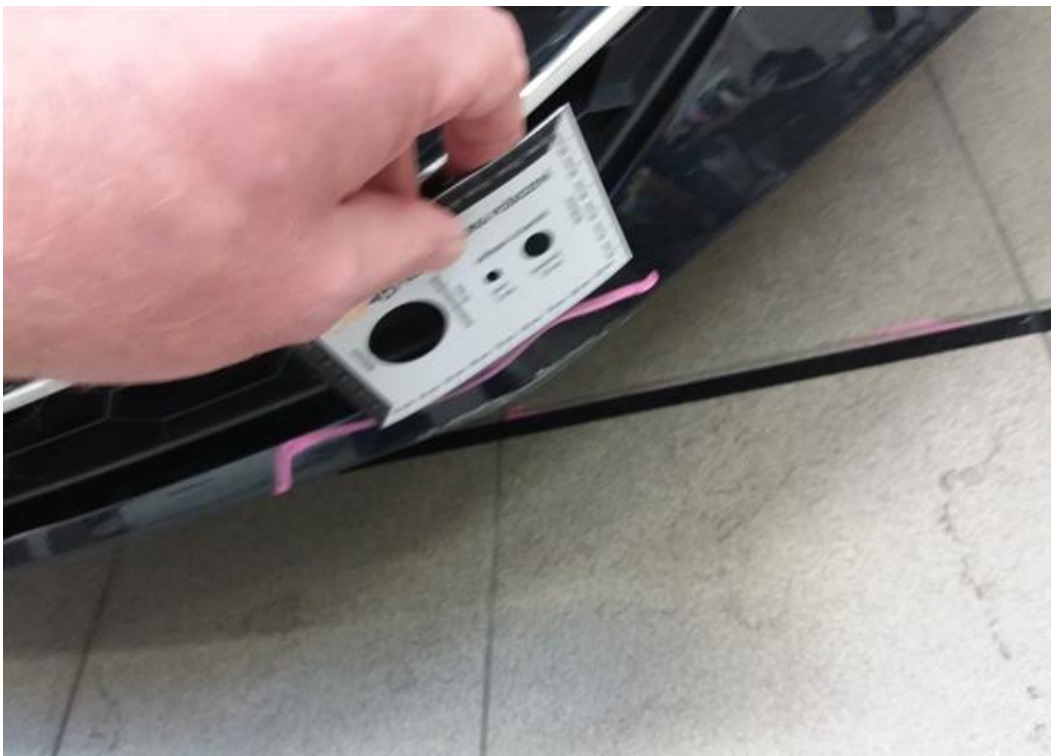
Viz popis k poškození č. 2