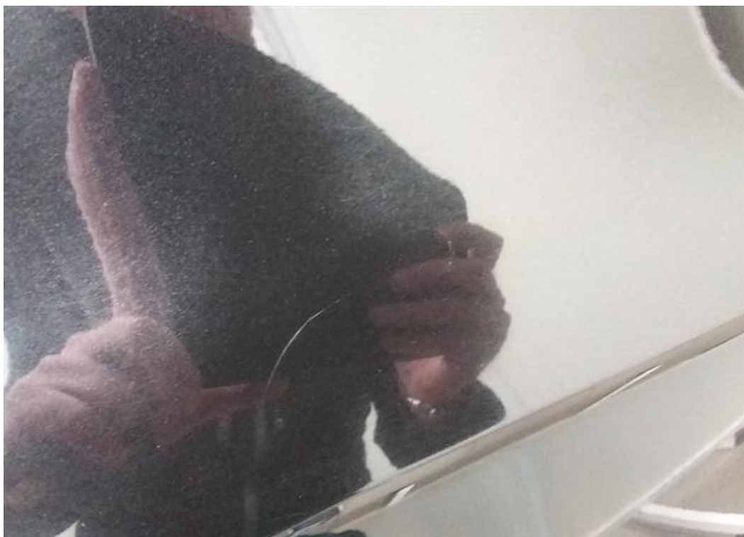
Viz popis k poškození č. 6