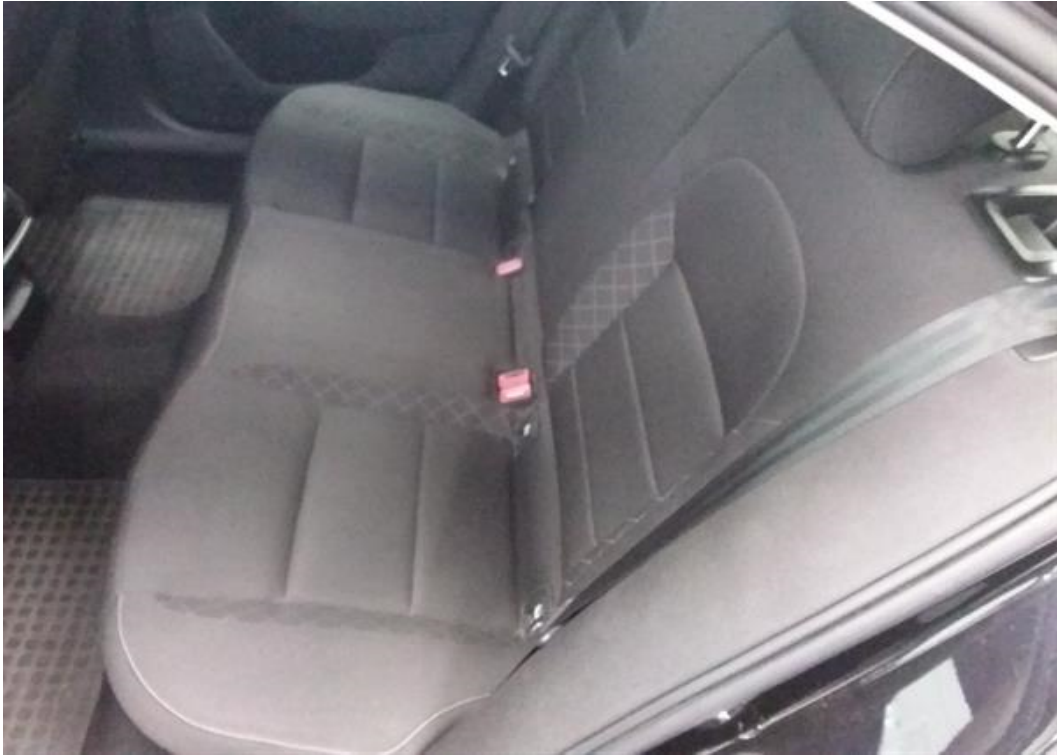
Zadní levé sedadlo