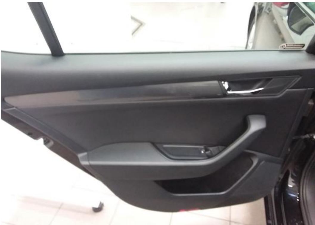
Zadní levé dveře vnitřní část