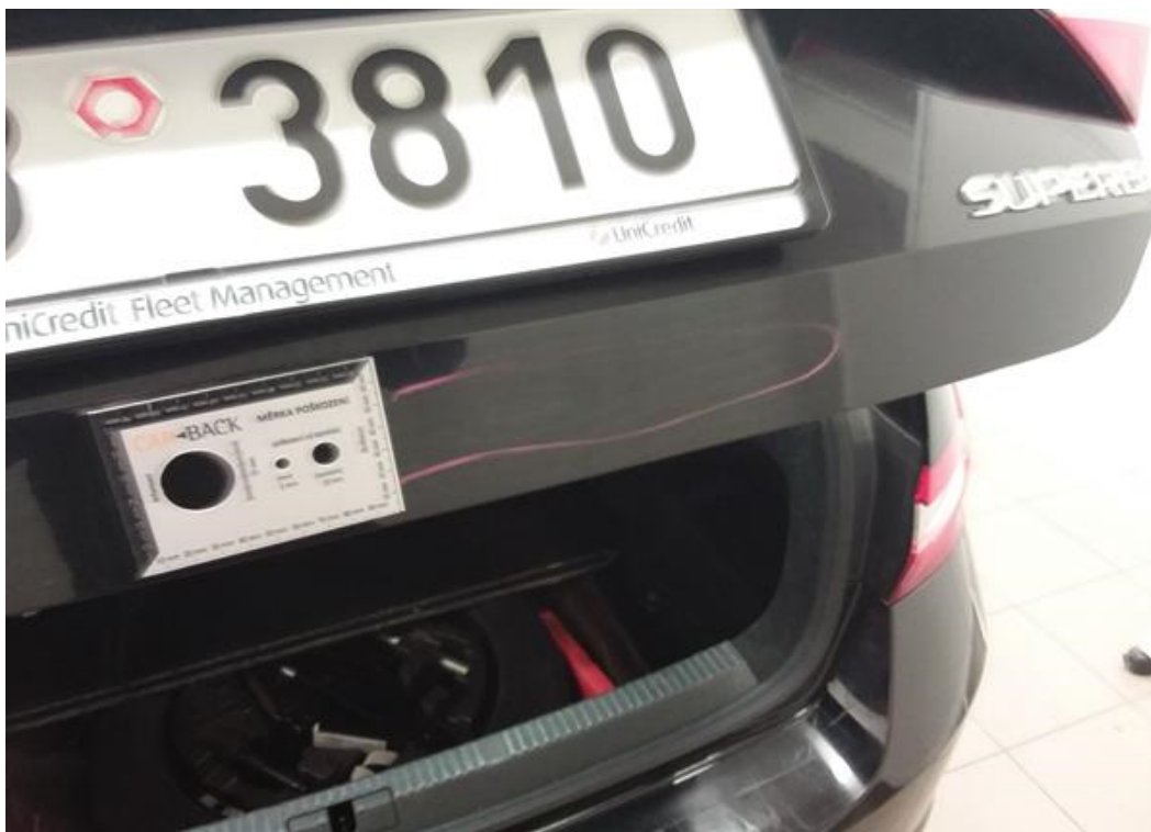
Viz popis k poškození č. 7