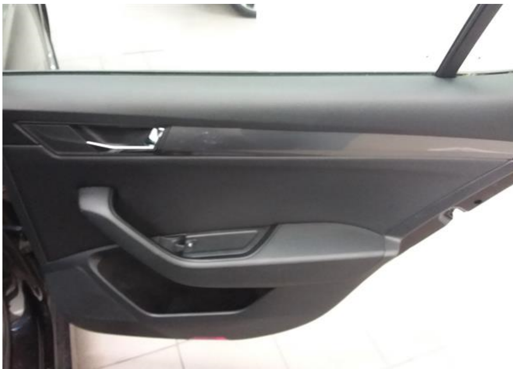
Zadní pravé dveře vnitřní část