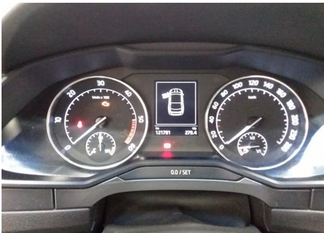
Palubní deska od řidiče