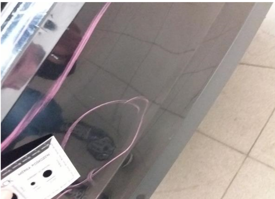
Viz popis k poškození č. 1