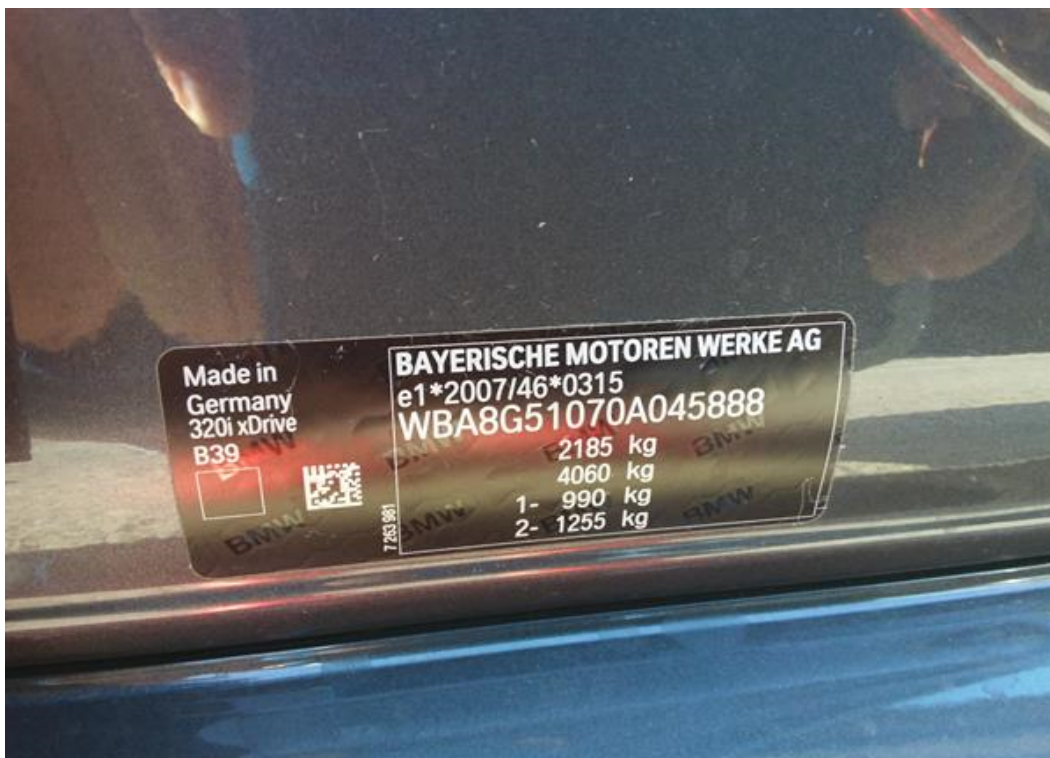
Foto VIN 1