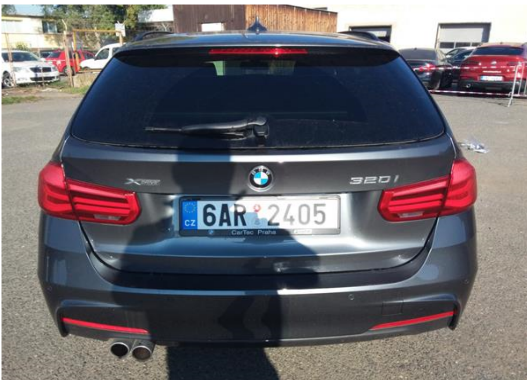
Zadní část vozu