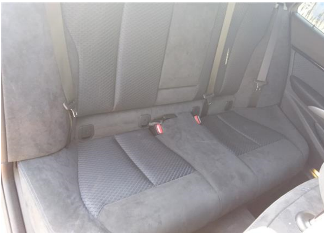
Zadní pravé sedadlo