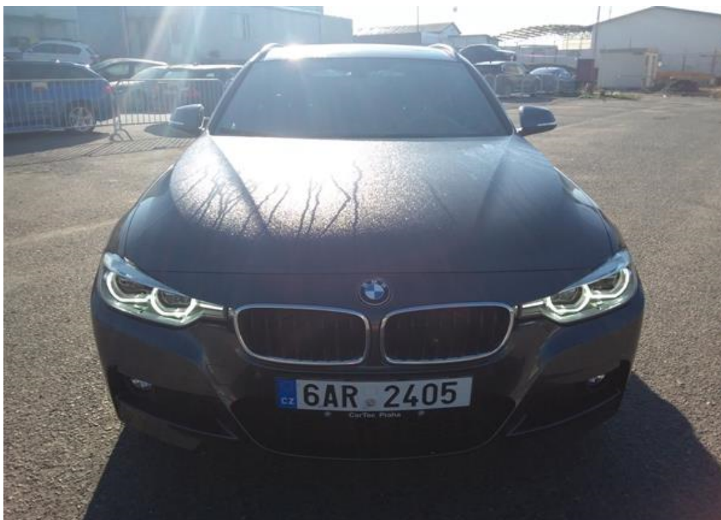
Přední část vozu