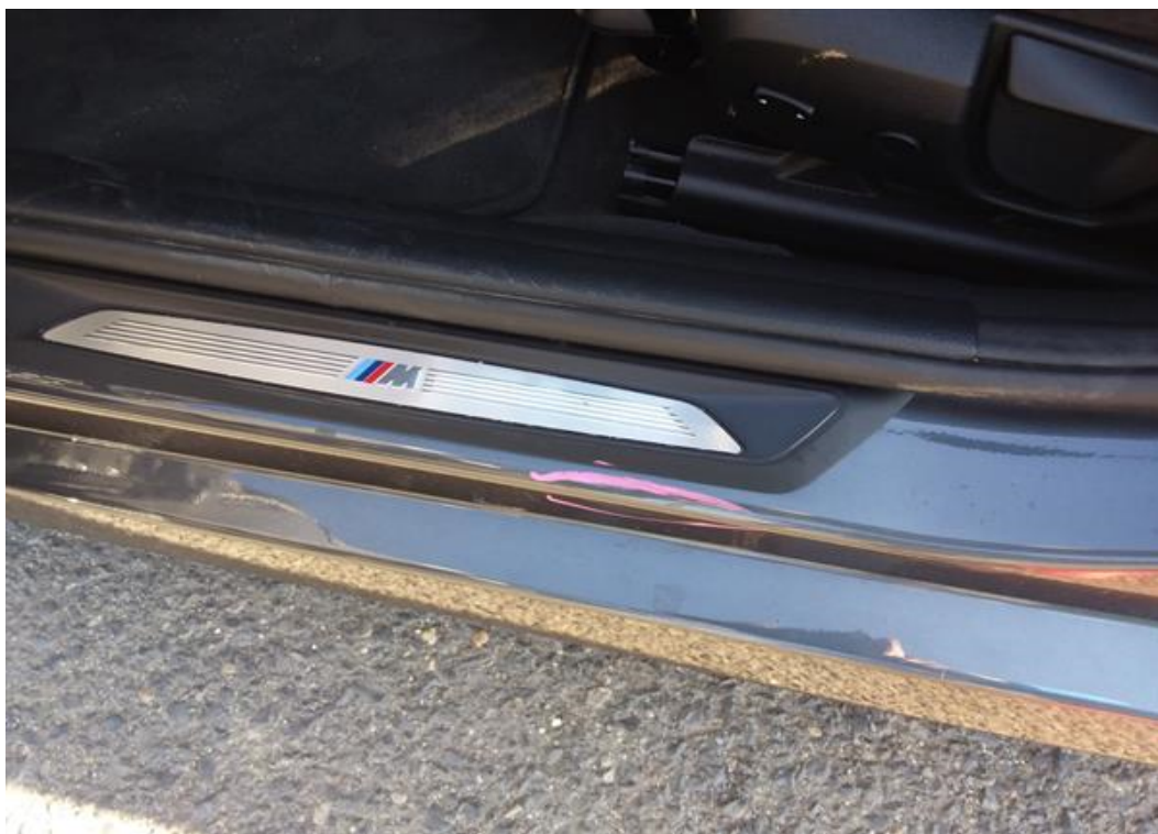
Viz popis k poškození č. 6