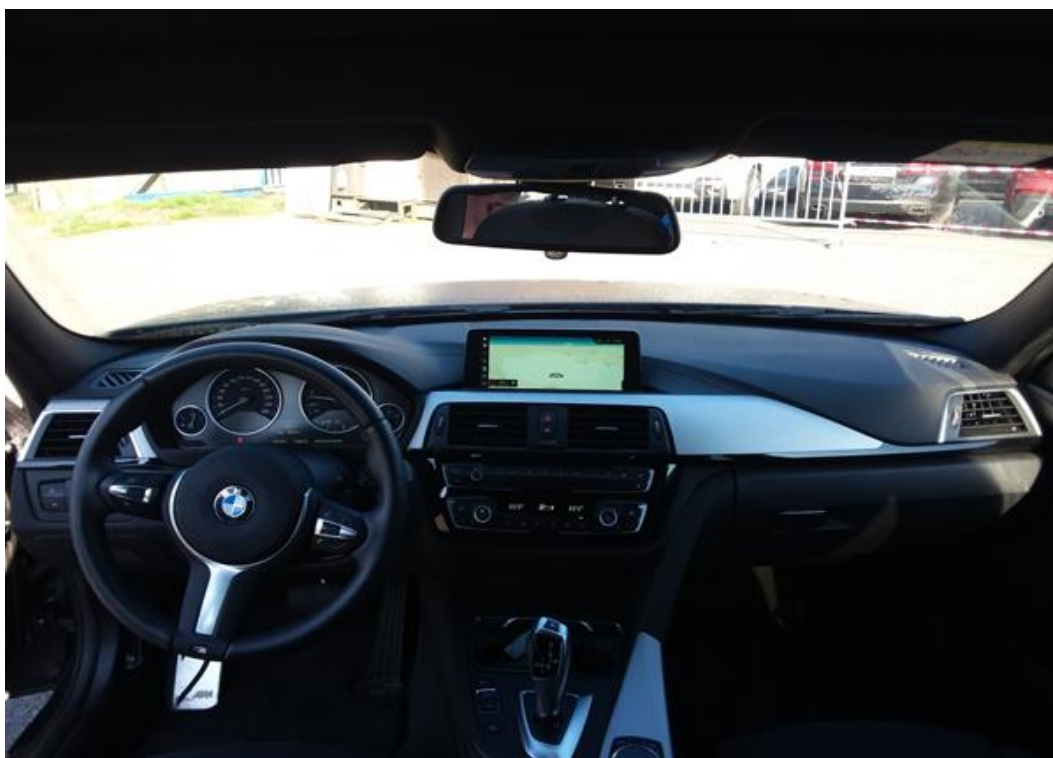
Palubní deska celá