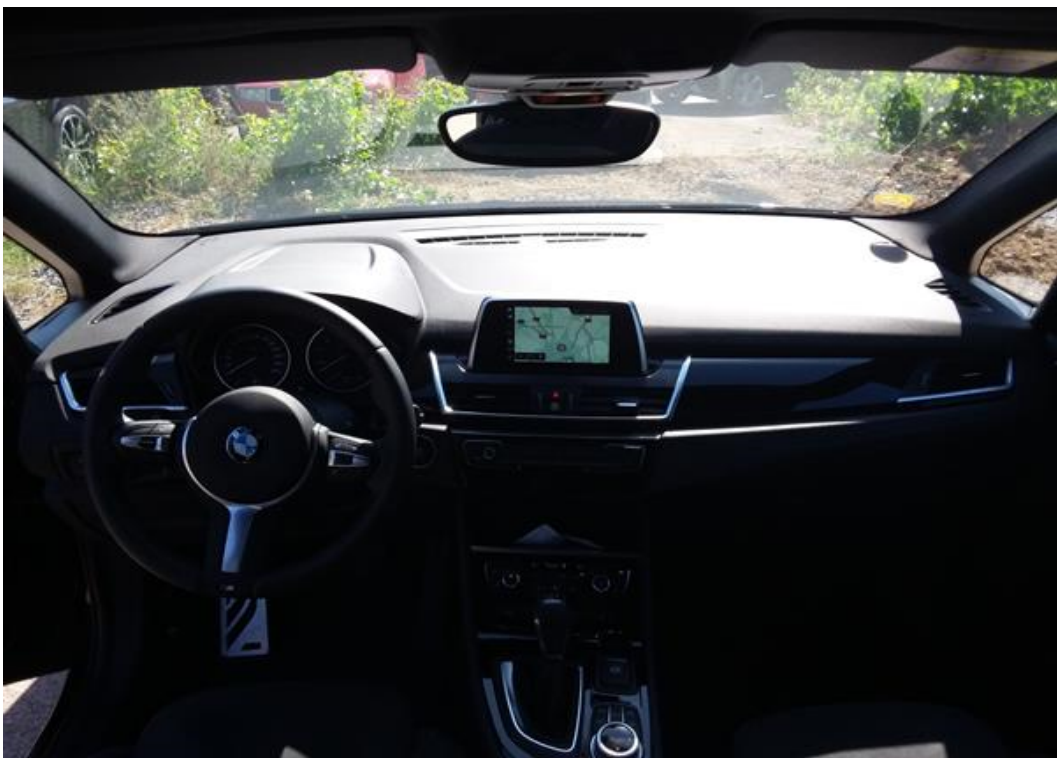
Palubní deska celá