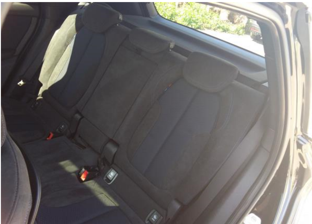
Zadní levé sedadlo