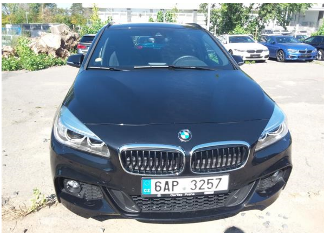
Přední část vozu