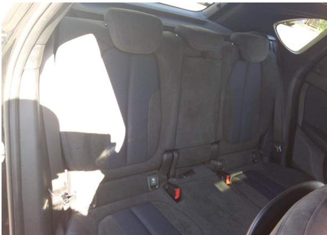
Zadní pravé sedadlo