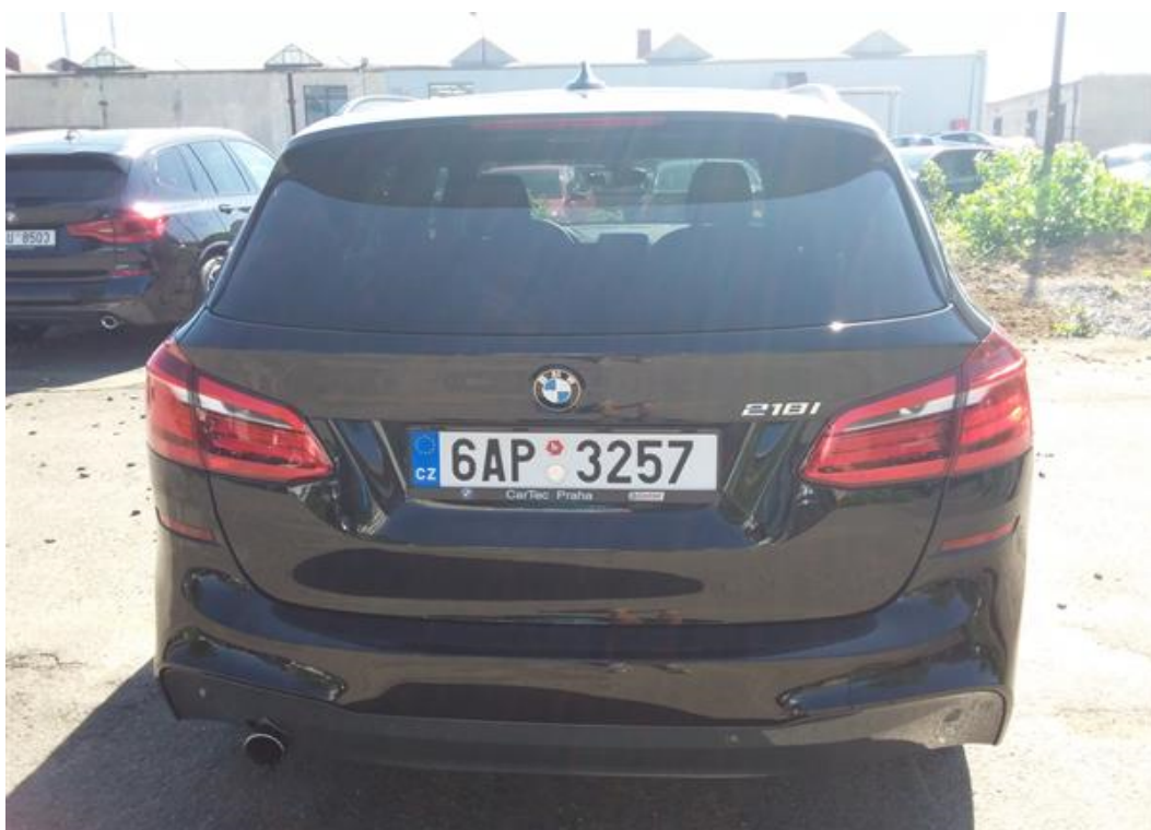
Zadní část vozu